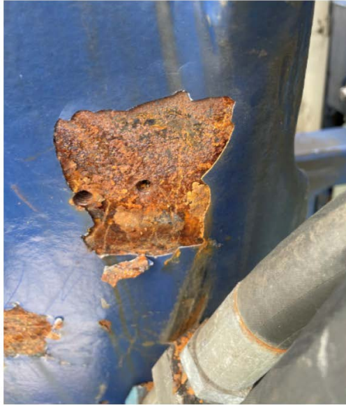
8.2 Rust / corrosion and paint damage §17 / §18