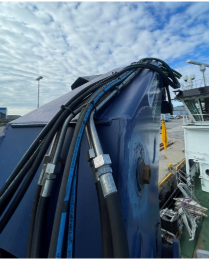
5.2 All hoses and pipes in the hydraulic system $9